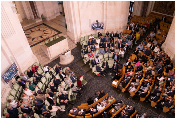
Cérémonie de remise du Grand Prix en cinéma et audiovisuel à Agnès Jaoui, 27 septembre 2023.

L'Académie des beaux-arts est l'une des 5 académies réunies à l'Institut de France. Accueillant 67 membres, 16 membres associés étrangers et 67 correspondants, elle veille à la défense du patrimoine culturel français et encourage la création artistique dans toutes ses expressions en soutenant de très nombreux artistes et associations par l'organisation de concours, l'attribution de prix, le financement de résidences d'artistes et l'octroi de subventions à des projets et manifestations de nature artistique. Instance consultative auprès des pouvoirs publics, l'Académie des beaux-arts conduit également une activité de réflexion sur les questions d'ordre artistique. Elle entretient en outre une politique active de partenariats avec un important réseau d'institutions culturelles et de mécènes. Afin de mener à bien ces missions, l'Académie des beaux-arts gère son patrimoine constitué de dons et legs, mais également d'importants sites culturels tels que, notamment, le Musée Marmottan Monet (Paris), la Villa et la Bibliothèque Marmottan (Boulogne-Billancourt), la Maison et les jardins de Claude Monet (Giverny), la Villa et les jardins Ephrussi de Rothschild (Saint-Jean-Cap-Ferrat), la Maison-atelier Lurçat (Paris), la Villa Dufraigne (Chars), l'Appartement d'Auguste Perret (Paris), ainsi que la Galerie Vivienne (Paris) dont elle est copropriétaire.