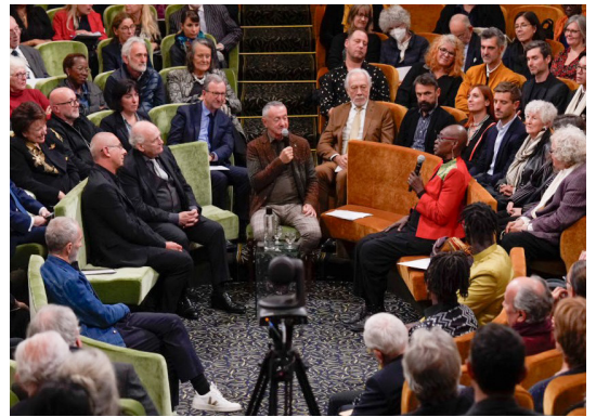
Cérémonie de remise du Grand Prix en chorégraphie à Germaine Acogny, 25 octobre 2023.