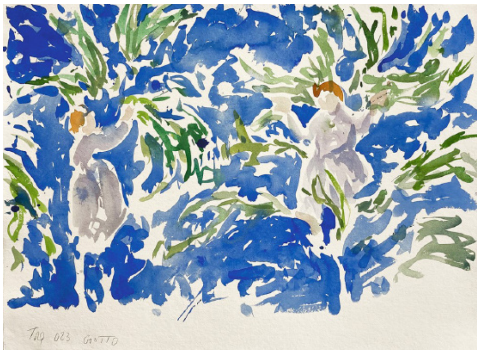
Sans titre (Giotto) , 2023, aquarelle sur papier, 56,5 x 77,2 cm, © ADAGP, Paris, 2024

Ses œuvres sont présentes notamment dans les collections du Centre Pompidou, du Musée national d'Art moderne, du Mac/Val (Vitry), du MAMAC (Nice), de la Maison Européenne de la Photographie et de plusieurs FRAC.