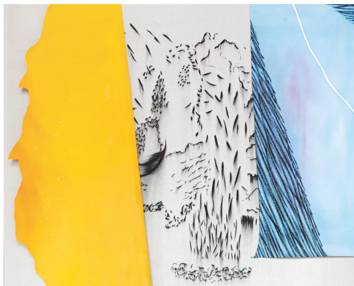
Catherine Violet, Sans titre , série Les Météores , 2020 fusain, huile et pastel sur toile, 140x185 © Catherine Violet

Le Prix de peinture de la Fondation Simone et Cino Del Duca est doté d'un montant de 25 000 €.