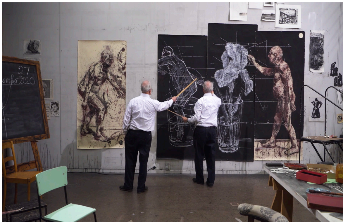
William Kentridge dans son atelier.