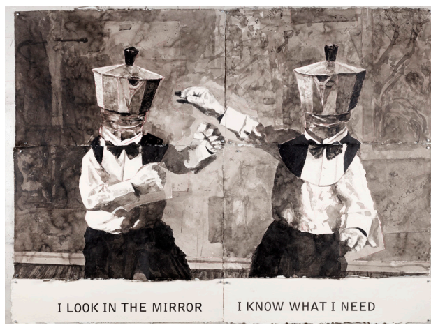
I Look in the Mirror, I Know What I Need , 2023, encre de Chine et crayon de couleur sur papier.