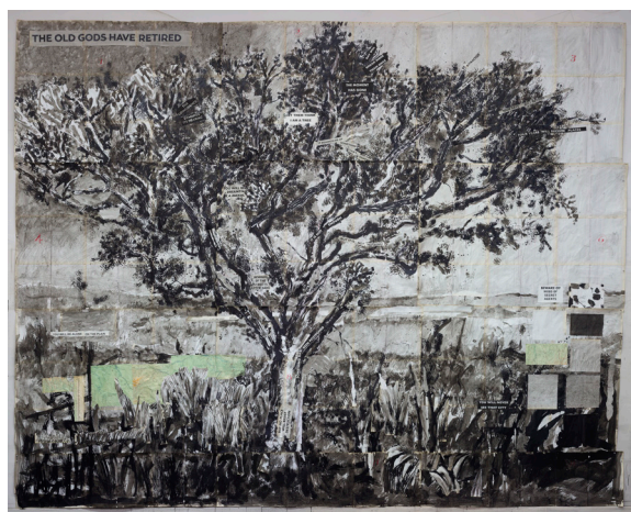
The Moment Has Gone , 2020, papier et collage sur papier.