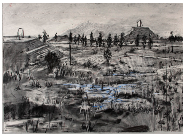
Drawing for Other Faces (Landscape with Two Mine Dumps) , 2011, charbon et pastel sur papier.